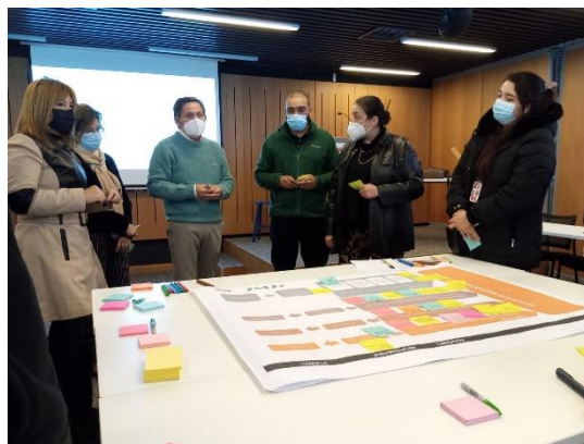
Registro reunión presencial CChC Valparaíso

Lineamientos. Este esquema este se sometió a revisión y discusión por parte de los integrantes de la mesa en una sesión presencial en la sede CChC Valparaíso para poder nutrir y consolidar el contenido de la estrategia y su plan de acción o implementación.